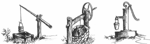
foto: z monografie „Visolaje“

Medzi najdôležitejšie podmienky života patrí voda. Prvé osady preto vznikali pri potokoch a riekach.