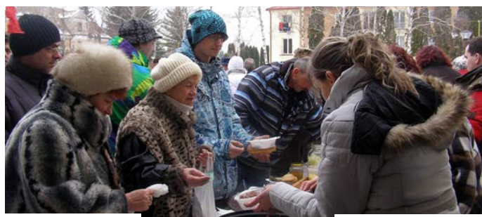
str. 6 LZ 02 / 2015

Minulý rok veľké plochy PD Košeca boli obsiate kukuricou. Poľovná zver, hlavne diviacia, tieto lokality takmer vôbec neopúšťa. Väčšiu časť roka trávila v týchto plodinách a robila doslova „výpady“ na súkromné polička obyvateľov. V týchto lokalitách majú jednoducho všetko, čo potrebujú na prežitie, či je to pokoj, voda a hlavne dostatočné množstvo krmiva. To je dôvod, prečo sa do lesa ani nevracajú. Veríme, že v budúcnosti sa táto situácia zmení k lepšiemu a veríme, že aj rozhnevaní majitelia pozemkov nájdu spoločnú reč s poľovníkmi.