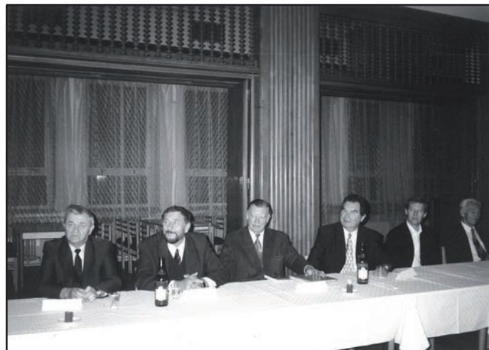
Spomienka na jeden z prvých ročníkov súťaže Koyšových Ladiec

1994 – Považská cementáreň sa stáva akciovou spoločnosťou (15)