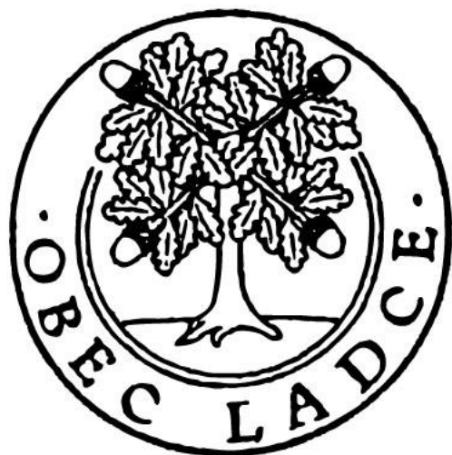
Pečať obce Ladce