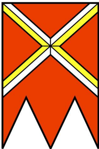
Vlajka obce Ladce