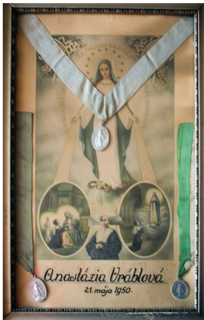
Pamätný list na prijatie do Mariánskej Družiny