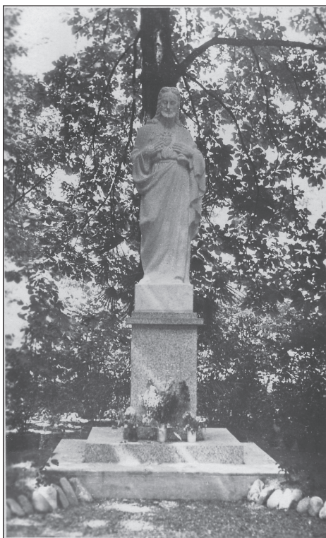
Socha Božského Srdca Ježišovho v parku