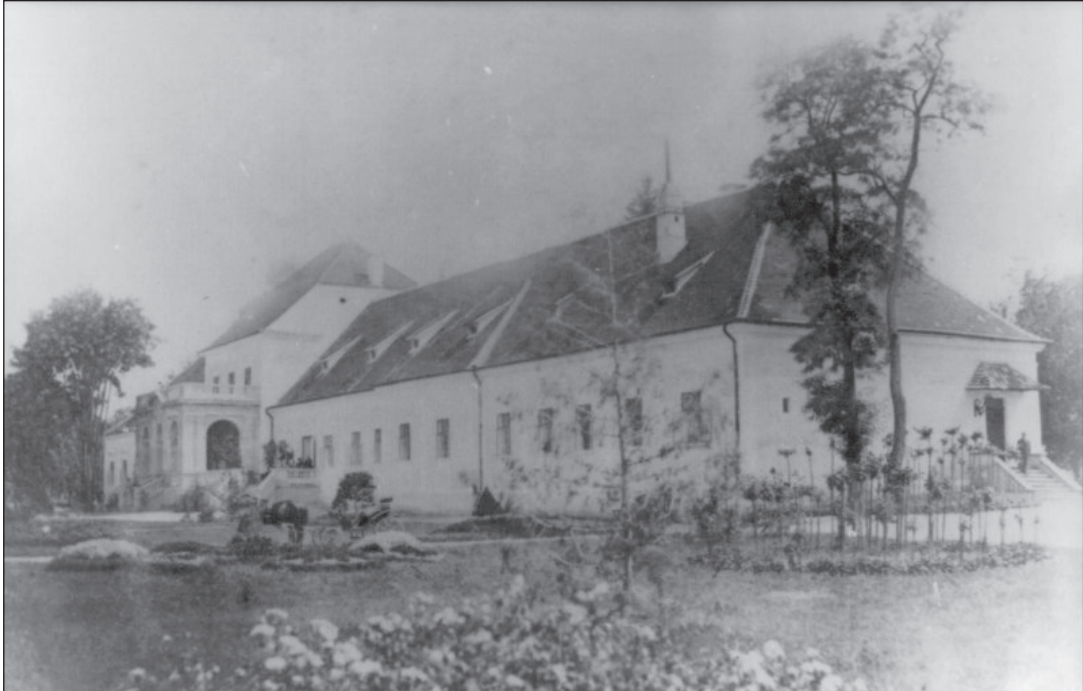
Kaštieľ na fotografii z r. 1888