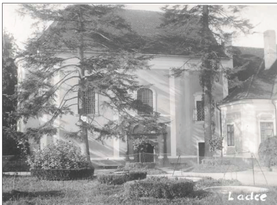
Kostol sv. Valentína