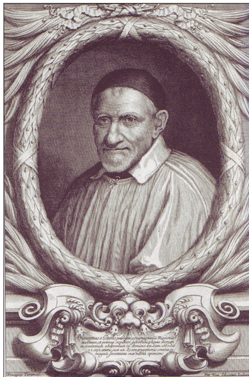
Sv. Vincent de Paul (* 24. apríl 1581, † 27. september 1660)