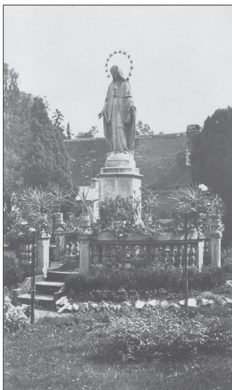
Socha Panny Márie na nádvorí Ústredného domu