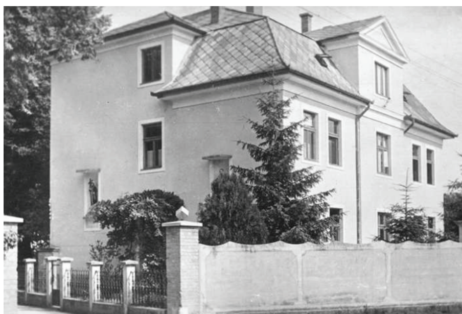
Misijný dom postavený v r. 1927