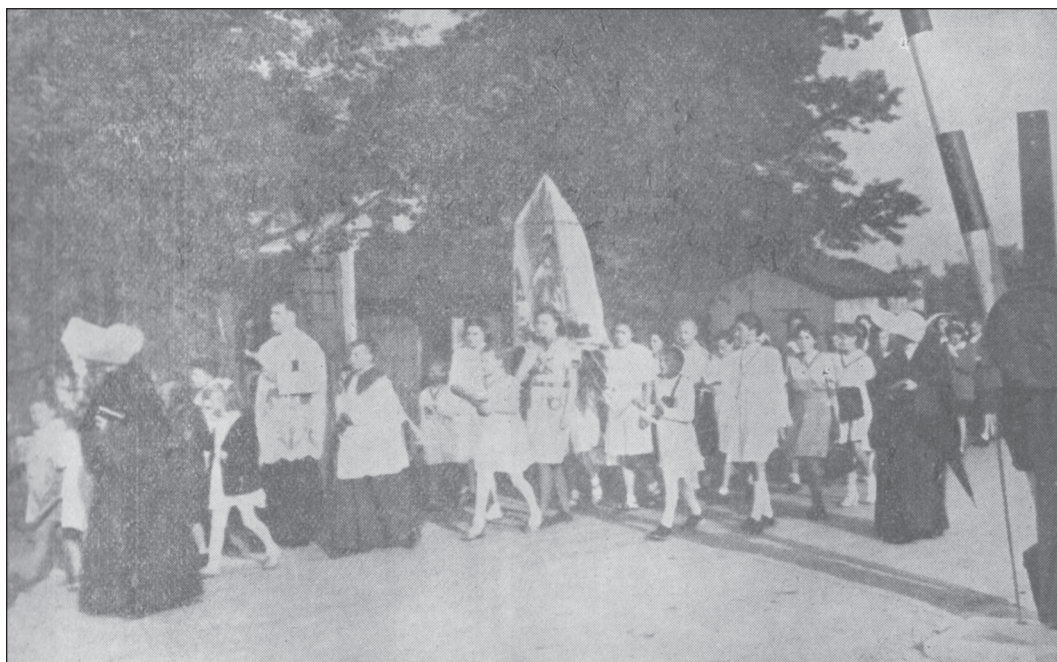
Púť mariánskej mládeže do Dubnice nad Váhom 8. júna 1930