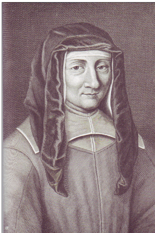
Sv. Lujza de Marillac (* 12. august 1591, † 15. marec 1660)