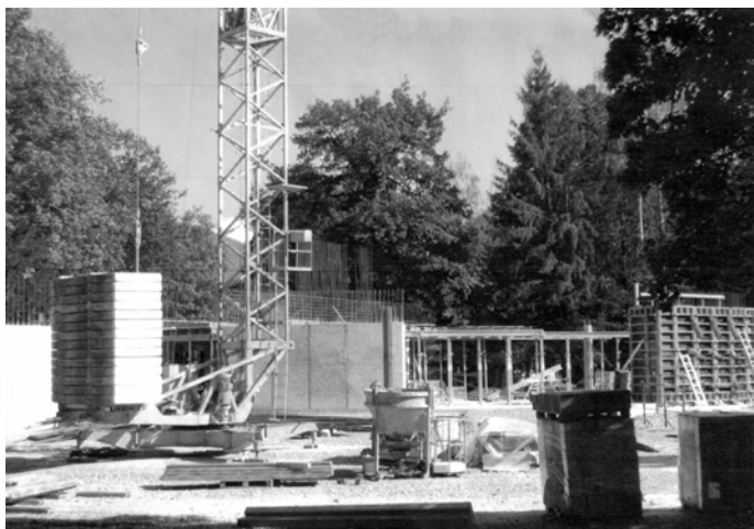
Stav: koniec septembra 2014

Stavba Rímskokatolíckeho kostola v Ladcoch napreduje aj napriek nie zrovna najpriaznivejšiemu počasiu.