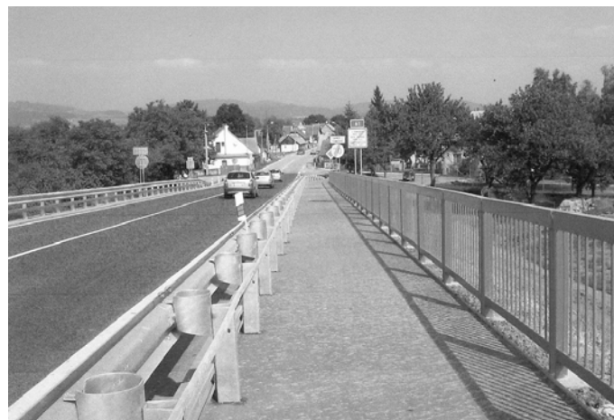
Chodník pre peších na novom nadjazde v Tunežiaciach.

Príspevok sa platí mesačne do 30. dňa príslušného kalendárneho mesiaca poštovou poukážkou, prípadne bezhotovostne na účet.