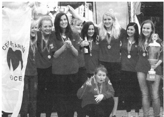
Majsterky Slovenska, víťazky Slovensko-moravskej ligy - členky DHZ v Ladcoch.