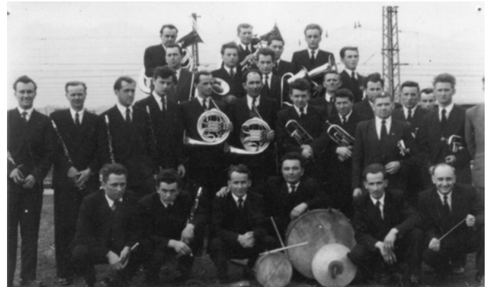
spojené hudby po roku 1954